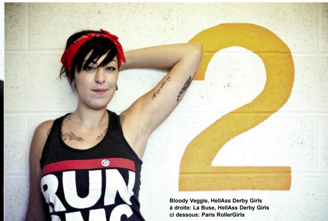
Bloody Veggie, HellAss Derby Girls à droite: La Buse, HellAss Derby Girls ci dessous: Paris RollerGirls

gagnant, un pactole à la clé. Résultat, les bagarres étaient nombreuses, ce que le public appréciait particulièrement, quand les concurrents se clashent et se crashent. C'est comme ça que le roller Derby est né ». Ayant connu son âge d'or dans les années 60 et 70. Disparu entre les années 80 et 90, puis ressuscité au début des années 2000, il a aujourd'hui pris une vraie tournure féministe, vitaminée, tatouée et carrément rock n' roll, tout en conservant sa base sportive. La raison de ce regain d'intérêt et de son arrivée