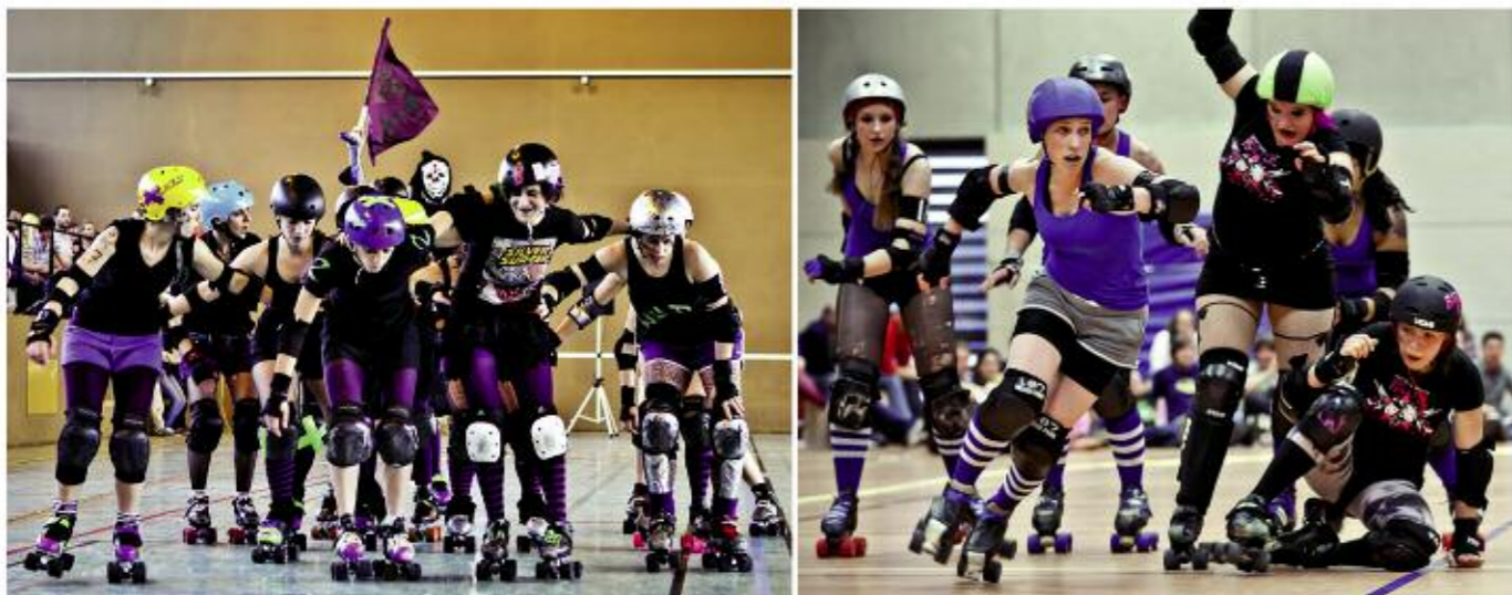
Ci dessous: HellAss Derby Girls Ci dessus: Roller Derby Bordeaux Club, et Paris RollerGirls contre le team de Stuttgart Page de droite: Mad Cat & Freaks'n'Pink, HellAss Derby Girls